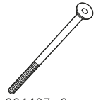
6 304407 x2 M8 x 130 Din 7991